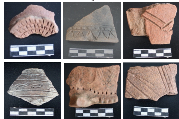
Gambar 1,2,3,4,5, dan 6. Foto gerabah hias situs Wayputih.

Analisis data arkeologi lebih banyak disandarkan pada temuan gerabah lokal, hal ini karena temuan ini merupakan temuan yang paling dominan dan ditemukan pada seluruh situs yang telah disurvei. Berdasarkan analisis terhadap gerabah baik itu dari aspek morfologi maupun teknologi, menunjukkan situs wayputih telah mengenal penggunaan gerabah dalam jangka waktu lama dan berlangsung intensif. Berbagai jenis gerabah menunjukkan banyaknya variasi penggunaan gerabah baik untuk keperluan rumah tangga sehari-hari maupun keperluan yang berhubungan dengan ritual tertentu. Gerabah merupakan temuan artefaktual yang paling dominan ditemukan di situs Wayputih, baik di situs terbuka maupun situs gua. Secara garis besar, temuan gerabah tersebut mewakili bentuk wadah dan non wadah, dengan kuantitas yang dominan merupakan bentuk wadah. Dari beberapa pengamatan terhadap atribut gerabah baik bentuk tepian, orientasi tepian, dan analisis metrik, diperkirakan gerabah tersebut mewakili bentuk tempayan, periuk, piring, forna (cetakan sagu), mangkuk, wadah yang mempunyai pegangan, tutup, kaki dan bentuk lainnya.