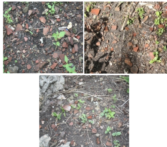
Gambar 9, 10, dan 11. Sebaran gerabah dengan konsentrasi yang sangat padat di pesisir pantai situs Wayputih

bahwa perdagangan lokal di wilayah tersebut, dengan pertukaran komoditi rempah-rempah dan produk-produk lokal, seperti gerabah lebih dominan. Mungkin dalam konteks ini, Wayputih, meskipun sebagai salah satu pusat cengkeh Kerajaan Hoamoal, namun bukanlah pihak yang berhubungan langsung dengan pedagang asing. Selain itu masyarakat, lebih sering menggunakan produk lokal untuk kebutuhan rumah tangga, karena pemasok barang yang langsung berhubungan dengan Wayputih adalah pedagang-pedagang lokal dari wilayah Maluku sendiri.