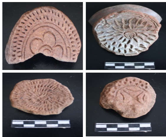
Gambar 12, 13, 14, dan 15. Motif Hias gerabah, yang kemungkinan menunjukkan gerabah khas Pulau Seram, mengingat jenis gerabah ini hampir selalu ditemui di situs-situs pemukiman di Pulau Seram.

karena pertama : kondisi lingkungan yang didominasi oleh lapisan tanah merah dan batuan karst, tidak memungkinkan untuk pencarian bahan baku gerabah. Kedua : tidak ada tradisi tutur yang mengatakan bahwa masyarakat di situs Wayputih adalah penghasil gerabah. Ketiga : pada masyarakat sekarang, tidak ada penggunaan gerabah yang intensif untuk keperluan sehari-hari. Keempat ; gerabah-gerabah yang ditemukan banyak diantara memiliki ciri yang sama dengan gerabah dari luar, baik Mare (Maluku Utara), Desa Ouw (Pulau Saparua) maupun Banda. Sedangkan apakah terdapat gerabah yang berasal dari Pulau Seram sendiri, masih perlu diteliti kembali, beberapa petunjuk tentang itu tampaknya dapat diselidiki bahwa diantaranya terdapat motif hias yang khas pulau Seram, karena dari berbagai penelitian, motif gerabah ini hampir selalu ditemukan di situs-situs di wilayah Pulau Seram, yakni motif hias titik-titik, atau bintik-bintik, tampak seperti segitiga tumpal, yang digoreskan atau dengan cara tusuk dengan alat tertentu semacam lidi, pada permukaan dasar gerabah bagian dalam dan diletakkan melingkar dan berkelompok. Biasanya di bagian tengah, dihias lagi seperti motif hias flora atau geometris.