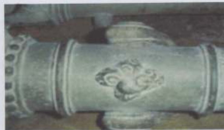
Foto 4. Motif Hias Padma / Lotus pada badan bagian bawah meriam