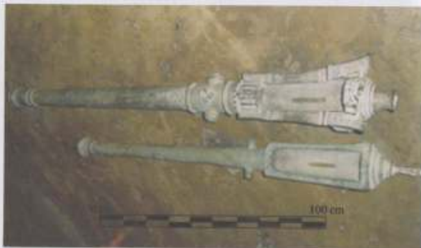
Foto 1. Sepasang Meriam Pusaka Negeri Elpa Putih, Maluku Tengah