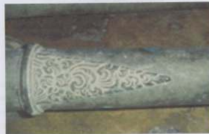
Foto 3. Motif hiasan ukiran pada badan tengah meriam