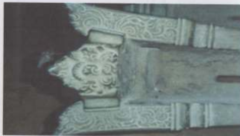
Foto 2. Hiasan ukiran berbentuk kupa dan menyerupai Kala Makara pada pangkal Meriam