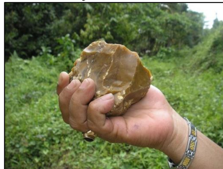
Gambar 5. Temuan artefak paleolitik jenis kapak penetak dengan jejak pangkasan yang masih segar dari aliran Sungai Wae Putih-Putih di Maluku Tengah

meskipun secara logis tidak tertutup kemungkinan juga dikembangkan alat-alat dari bahan lain dari bahan tanduk, tulang, dan kayu (Soejono, 1987: 91-104). Tidak seimbanginya penemuan alat-alat batu dibandingkan dengan peralatan yang menggunakan bahan organik lain tersebut, karena bahan organik lebih cepat mengalami kerusakan sehingga jarang ditemukan (Crabtree, 1972). Kenyataan lain juga membuktikan bahwa setiap penemuan sisa manusia purba di suatu situs tidak pernah diikuti oleh penemuan peralatannya. Sebaliknya, setiap kali ditemukan alat-alat batu dalam suatu situs jarang diikuti temuan manusia pendukungnya. Oleh karena itu, di Indonesia hanya dikenal adanya dua jenis situs tertua, yaitu situs hominid yang dicirikan oleh tinggalan fosil-fosil manusia dan hewan (seperti di Sangiran, Pening, Kedungbrubus, Trinil, dsb) dan situs-situs paleolitik dengan tinggalan artefak yang sangat menonjol (seperti di Kali Baksoka, Cabenge, Kali Ogan, dan Manikin-Noelbaki,) (Simanjuntak, 2000: 1-14).