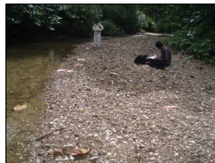
Gambar 3. Survei permukaan pada aliran Sungai Wae Sapalewa di Maluku Tengah

Berdasarkan data yang berhasil dihimpun melalui penelitian selama ini, populasi sebaran budaya Pleistosen (alat-alat paleolitik) hampir didapatkan di setiap kepulauan di Indonesia; yaitu mulai dari Sumatera (Nias, Lahat, Baturaja, Tambangsawah, Kalianda), Jawa (Ciamis, Jampang Kulon, Parigi, Gombong, Sangiran, Punung, dsb), Kalimantan Selatan (Awangbangkal), Sulawesi Selatan (Cabenge, Paroto, Rala, Wallanae, dsb), Bali (Sembiran, Trunyan), Lombok (Plambik, Batukliang), Sumbawa (Batutring), Sumba Barat (Langang Pamalar), Flores (Liang Mikel, Liang Bua, Cekungan Soa, dsb), Pulau Sabu, dan Timor Barat (Manikin-Noelbaki, Atambua) (Soejono, 1980; 1984; Widiyanto dkk, 1996; Jatmiko, 2000).