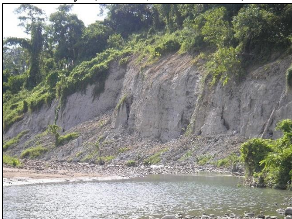
Gambar 4. Salah satu singkapan teras Sungai Wae Kupa di Kabupaten Seram Bagian Timur

Pada dasarnya manusia mempunyai suatu kelebihan berpikir (akal) dibandingkan dengan binatang. Salah satu kelebihan manusia pertama kali diwujudkan dalam bentuk budaya (peralatan) dari batu yang disebut alat paleolitik. Alat-alat paleolitik sebagai budaya tertua di muka bumi diduga telah muncul sejak ditemukannya bukti-bukti fosil manusia purba Homo erectus pada periode Pleistosen (sekitar dua juta – 11.700 tahun lalu) (Semah et al , 1992: 439-446 ). Pada Kala Pleistosen kehidupan manusia masih cenderung bergantung kepada alam, yaitu dengan cara hidup berburu dan meramu ( hunter-gatherer ). Sisa-sisa dari hewan buruan (seperti bagian tulang atau tanduk) seringkali dimanfaatkan untuk dibuat peralatan. Bentuk peralatan yang dibuat dari bahan tulang dan tanduk sudah banyak dibuktikan dalam penelitian arkeologi di Eropa dan Afrika (Clark, 1970), sedangkan di Indonesia temuan budaya (peralatan) dari Kala Pleistosen umumnya dibuat dari bahan batu atau kayu (Basoeki, 1986: 151-157).