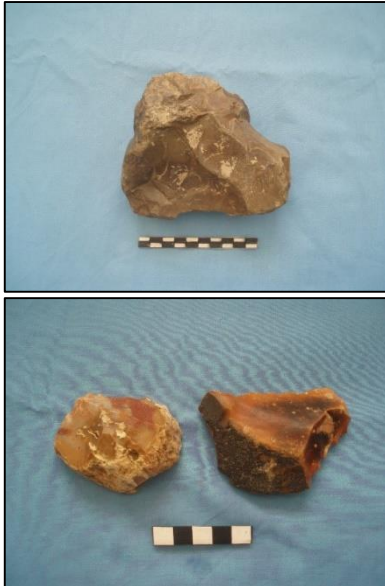
Gambar 6. Temuan artefak paleolitik jenis serut cekung besar dari aliran Sungai Wae Nif (atas) dan dua kapak perimbas dari Wae Putih-Putih (bawah) (Sumber: Dok. Puslit Arkenas)

secara eksploratif dan umumnya berada pada bantaran aliran-aliran sungai, sehingga tinggalan tersebut sudah mengalami “ reworking ” dan kehilangan konteks dari lingkungan pengendapan aslinya. Keterbatasan data tersebut sangat menyulitkan dalam merunut pemahaman kehidupan masa lampau yang pernah berlangsung.