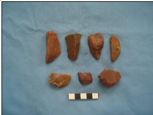
Gambar 7. Temuan artefak paleolitik jenis alat-alat serpih dari aliran Sungai Wae Ical

didominasi oleh alat-alat serpih, sedangkan jenis alat-alat masif lebih sedikit ditemukan. Jenis temuan alat-alat serpih di wilayah ini mempunyai persamaan dengan temuan serupa pada situs-situs tertua di Indonesia; yaitu di Sangiran (Situs Dayu dan Ngebung), Cekungan Soa (Matamenge dan Kobatuwa) dan Liang Bua, Flores (Widianto, dkk, 1996; Koenigswald, 1936: 52-62; Jatmiko, 2014). Salah satu temuan alat serpih yang sangat spesifik dan mempunyai ciri-ciri persamaan dengan di Situs Matamenge dan Liang Bua adalah tipe 'radial core', yaitu artefak yang di daur ulang atau diserpih lagi dari berbagai sisi sehingga menghasilkan beberapa permukaan seperti batu inti (Brum et al , 2006: 624-628).